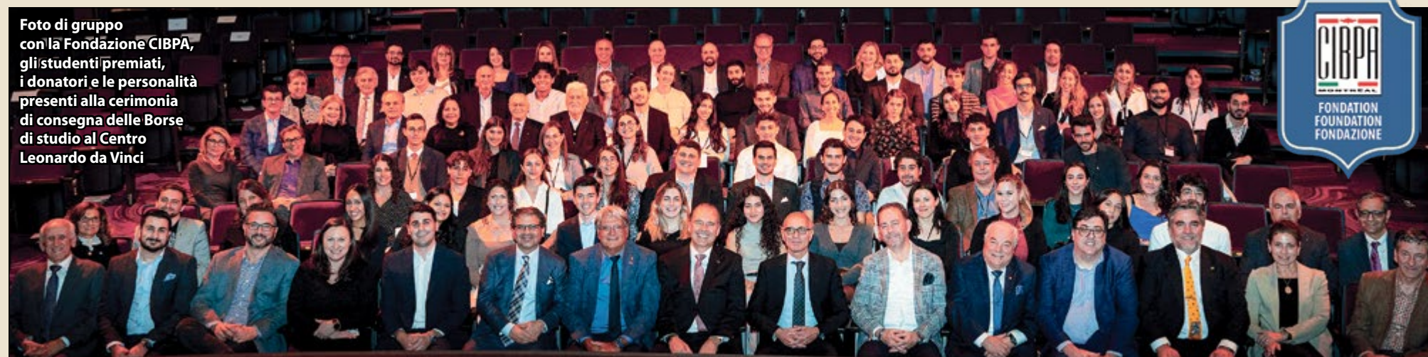
Foto di gruppo con la Fondazione CIBPA, gli studenti premiati, i donatori e le personalità presenti alla cerimonia di consegna delle Borse di studio al Centro Leonardo da Vinci